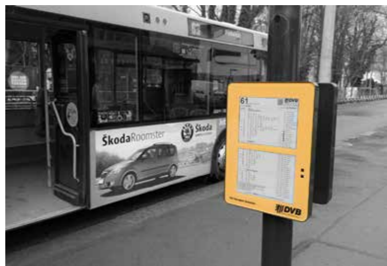
System cyfrowych rozkładów jazdy wykonanych w technologii e-papieru