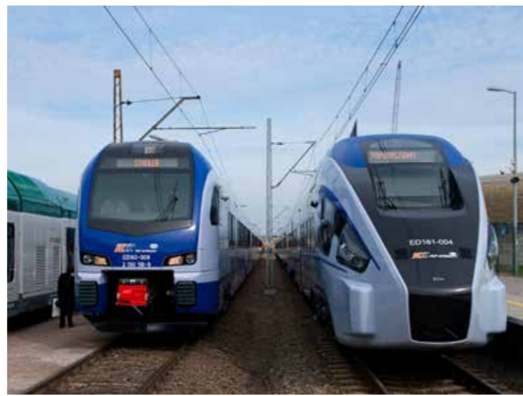
EZT FLIRT (z lewej) oraz DART w barwach PKP Intercity