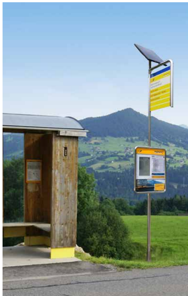
System cyfrowych rozkładów jazdy wykonanych w technologii e-papieru

Kolejna edycja międzynarodowych targów kolejowych TRAKO odbędzie się w dniach 26-29 września 2017 r.